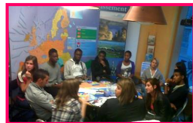
Réunion de préparation au CIED le 15 septembre 2011